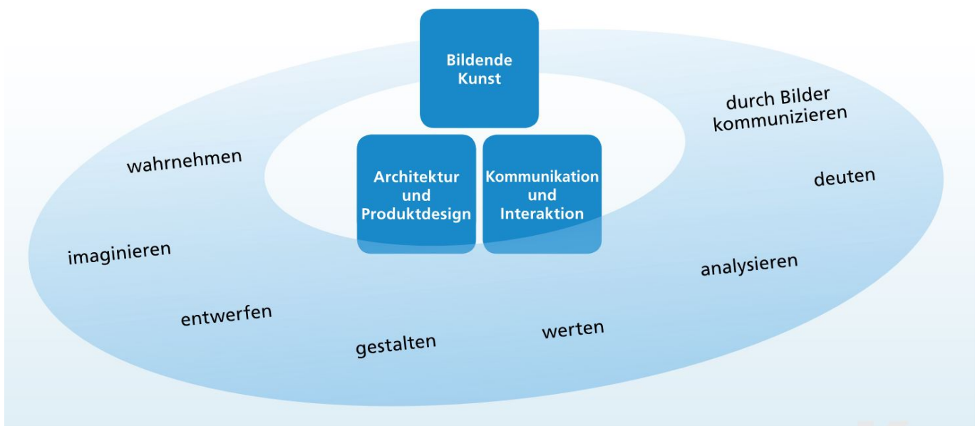
Abb. 1: Kompetenzmodell des bayerischen Lehrplans

Die Festlegungen in den drei Beispielen sind weitgehend kongruent mit leichten, inhaltlich jedoch irrelevanten Unterschieden. Während die KMK vor allem auf eine formale Beschreibung fokussiert (Gegenstand ist letztlich alles, was visuell erfahrbar ist), gehen die beiden Lehrpläne mal eher summarisch (Bayern), mal detaillierter (Schleswig Holstein) auf konkrete Kunst- oder Bildgattungen ein, wie sie dann später auch an Hochschulen oder Akademien studiert werden können.