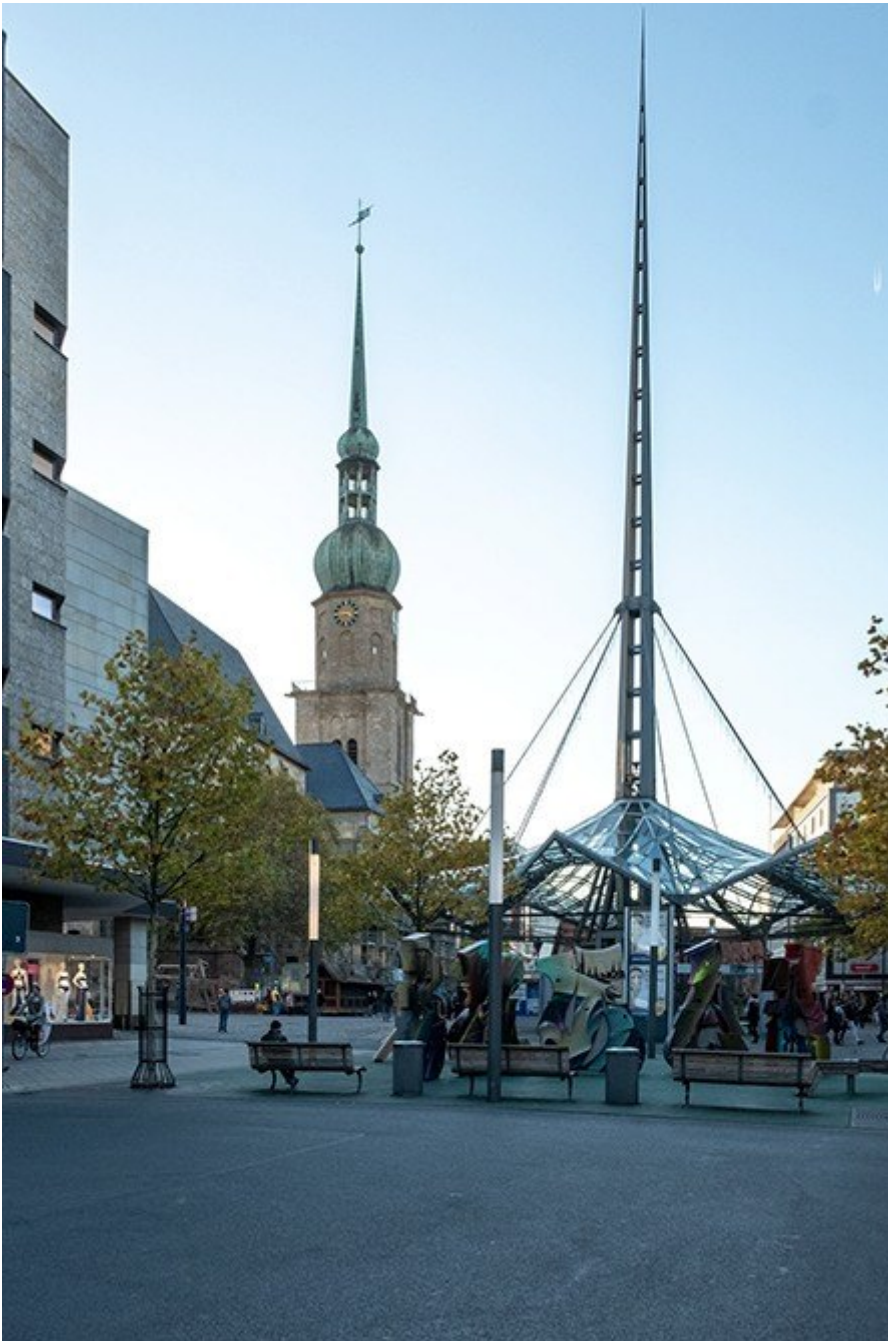
Abb. 2: Dortmund, Stadtkirche St. Reinoldi und U-Bahnhof Reinoldikirche

Das Auge der Kamera positioniert sich auf der Augenhöhe der Passanten in der Dortmunder Innenstadt. Das Bild gibt etwas zu sehen, das für Personen, die sich in der Stadt bewegen, in eben dieser Perspektive wahrzunehmen ist: einen Blick aus dem Brüderweg zum U-Bahnhof Reinoldikirche und auf die Stadtkirche. Das Bauwerk ist Teil der städtischen Umgebung. Diese Beobachtung lässt sich auch auf Narrative übertragen: Welche identitätskonkreten Erzählungen lassen sich mit diesem Denkmal verbinden? Individuell und im Austausch? Doch bevor – um dahin noch einmal zurückzukehren – diese „nahbare“ Ansicht (Abb. 2) das Dokumentationsfoto (Abb. 1) kurzerhand ersetzt, gilt es innezuhalten und zu fragen, was die Herauslösung des Bauwerks aus den aktuellen Alltagssituationen und Lebensvollzügen leistet. Oder anders