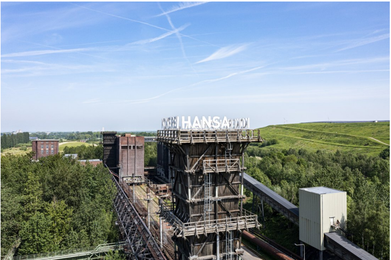
Abb. 5: Kokerei Hansa

Gerade die Umcodierung religiöser Bauten in säkulare Denkmäler – beziehungsweise anders als bei den Industriedenkmalen das komplexe Hinzutreten einer zweiten Codierung am selben Ort – ist unverzichtbare Voraussetzung für ihre menschheitliche, universale Bedeutung als Kulturdenkmal. Aus religiösen Gründen – so die Selbstverpflichtung in den diversen Kulturkonventionen – darf kein Kulturdenkmal zerstört werden; hier findet der internationale Protest gegen die Zerstörung der Buddha-Statuen in Bamiyan (2001) seine Begründung. Ebenso gelten für Kulturdenkmäler auch in kriegerischen Auseinandersetzungen Schutzbestimmungen, ihre Zerstörung ist Kriegsverbrechen, ihre systematische Zerstörung kann als genozidaler Akt bewertet werden (vgl. UNESCO 1954). Denkmalvermittlung sollte – so darf noch einmal wiederholt werden – diese Denkmalwerte einbeziehen. Sie ist immer auch Wertevermittlung vor der Folie der universellen Menschenrechte.