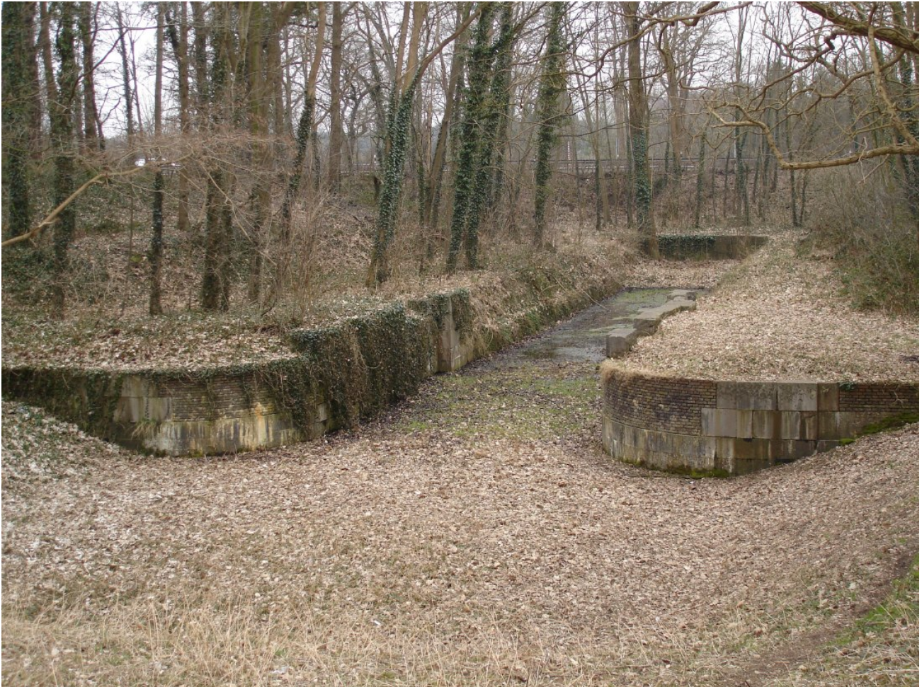
Abb. 4: Nordkanal zwischen Venlo und Neuss, Napoleonische Schleuse

Suggestiv bebildern lässt sich die Transformation exemplarisch mit der Klosterruine Heisterbach (Abb. 3) (vgl. stellvertretend Keller 2008). Das bedeutende Zisterzienserkloster war mit der Säkularisierung 1803 aufgegeben worden, der Bau fiel außer Gebrauch und wurde als Rohstoffressource genutzt: