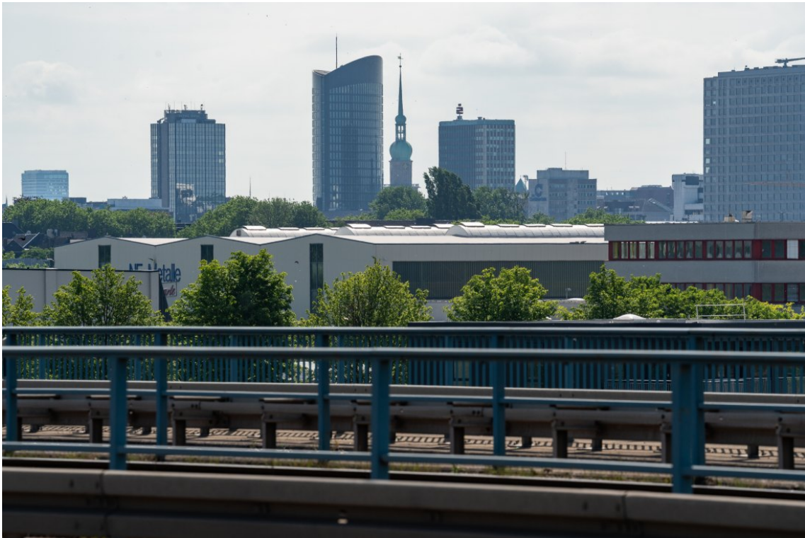
Abb. 6: Lukas Höhler: Stadtkirche St. Reinoldi, 2025, © Lukas Höhler

2025; vgl. auch Dobbert/Gliesmann/Welzel 2020).