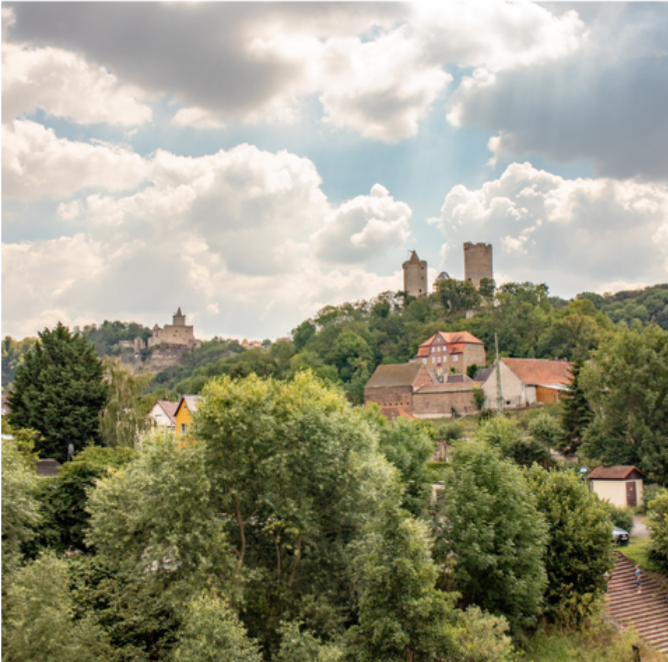
Abb. 1: Saaleck und Rudelsburg © Pressestelle Burgenlandkreis.

Über Jahrhunderte blieb diese hochmittelalterliche Kulturlandschaft weitestgehend erhalten. Im 19. Jahrhundert entwickelte sich der Begriff „Mythos Naumburg“, der sich auf den Dom und die Werke des Naumburger Meisters bezog – den Westlettner und Stifterfiguren, allem voran auf die Uta (Abb. 5 und s.u.) –, jedoch auch die geschichtsträchtige und liebevolle Landschaft mit ihren Burgen und Bauten einbezog. Künstler*innen wie der Maler Max Klinger, der Architekt Paul Schultze-Naumburg und die Puppenmacherin Käthe Kruse errichteten hier zu Beginn des 20. Jahrhunderts ihre Werkstätten.