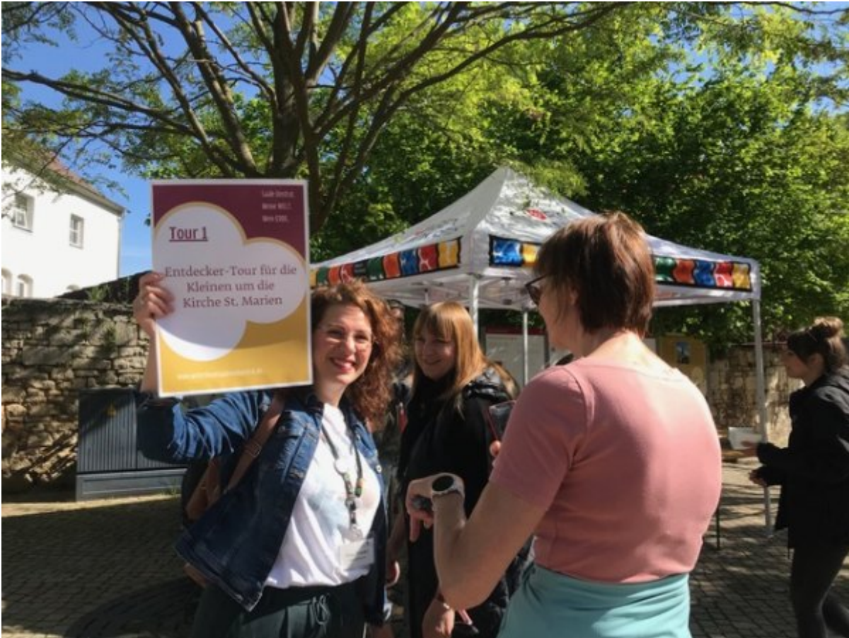
Abb. 8: Tourstart in Freyburg (Unstrut) 2025 © Birgit Wolf.

Der Förderverein Welterbe an Saale und Unstrut e.V. initiierte 2014 den Welterbe-Wandertag. Gemäß dem Motto ‚Saale-Unstrut auf dem Weg zum Welterbe, folgen Sie uns!‘ fand der Auftakt in und um Freyburg (Unstrut) statt. Gemeinsam mit Akteur*innen der Region – sie wissen am besten, was spannend ist und wer Ansprechpartner*innen sind – wurden fünf Touren mit geologischen, botanischen, kultur- und kirchenhistorischen ebenso wie genüsslichen und musikalischen Themen angeboten. Die Teilnehmenden konnten wählen, ob sie lieber zu Fuß oder mit dem Rad unterwegs sein wollten. Es galt die Vielfältigkeit und Schönheit der Region gemeinsam zu entdecken.