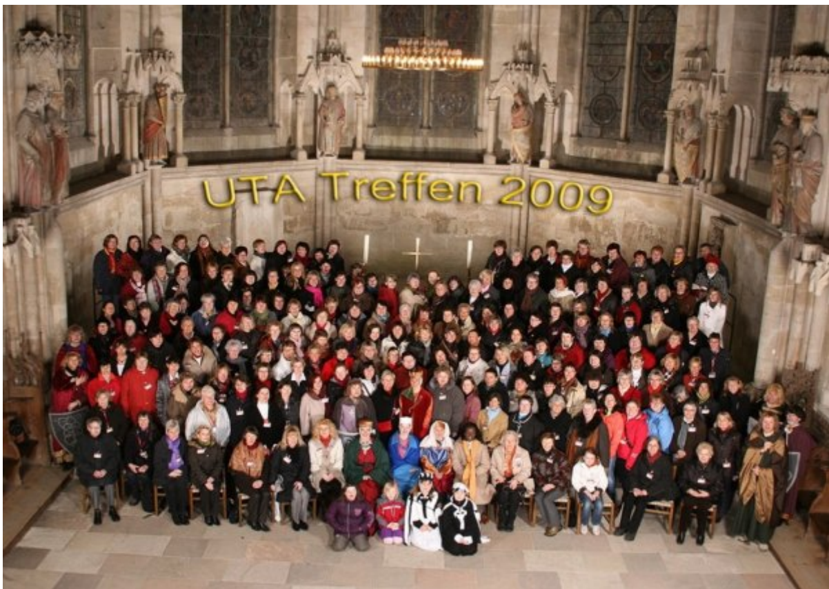
Abb. 6: UTA-Treffen © Vereinigte Domstifter - diartfoto.

Persönliches wird in Gemeinschaft erlebt: Die „schönste Frau des Mittelalters“ verbindet Frauen verschiedener Herkünfte und Generationen, die sich mit der Lebens- und Rezeptionsgeschichte Utas bis in die Gegenwart sowie den Lebensgeschichten der Namensvetterinnen auseinandersetzen, und somit ein anderes Bewusstsein für ihren Namen bekommen.