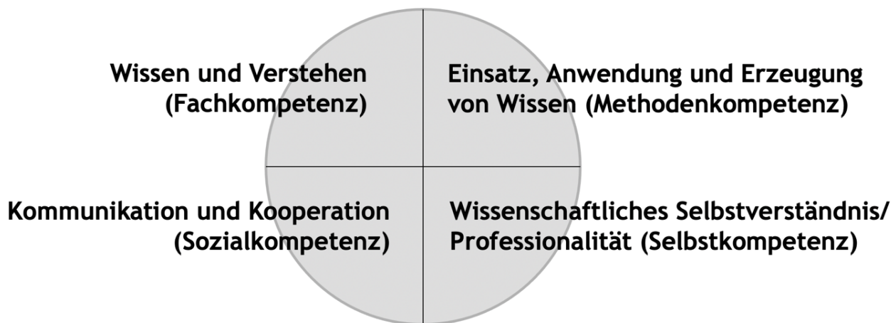
Abb. 1: Schematische Darstellung des Hochschulqualifikationsrahmens. Eigene Darstellung in Anlehnung an Kultusministerkonferenz 2017:4

Der Orientierungsrahmen für die Hochschullehre in Deutschland ist der Hochschulqualifikationsrahmen der Hochschulrektoren- und Kulturministerkonferenz (Kultusministerkonferenz 2017). Er sieht vor, dass Studierenden im Laufe des Studiums Fach-, Methoden-, Sozial- und Selbstkompetenzen vermittelt werden. Unter Fachkompetenz wird „Wissen und Verstehen“, unter Methodenkompetenz „Einsatz, Anwendung und Erzeugung von Wissen“, unter Sozialkompetenzen „Kommunikation und Kooperation“ und unter Selbstkompetenz „Wissenschaftliches Selbstverständnis/ Professionalität“ (Kultusministerkonferenz 2017:4) verstanden.