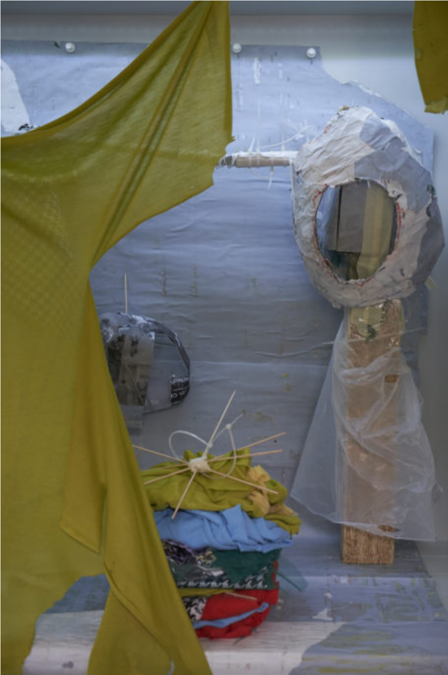
Abb. 7

Die Ausführungen der Künstlerin machen deutlich, dass ihre forschende Haltung von Intuition, Imagination sowie Zugängen zu den Kindern wie auch zu ihren Arbeiten in Form künstlerischer Arbeitsweisen geprägt ist. Gleichzeitig wird auch deutlich, dass die Künstlerin durch die Einführung des Fotografierens eine Form der künstlerischen Forschung und damit eine Möglichkeit der Intensivierung und Weiterentwicklung ihres Arbeitsprozesses ermöglicht.