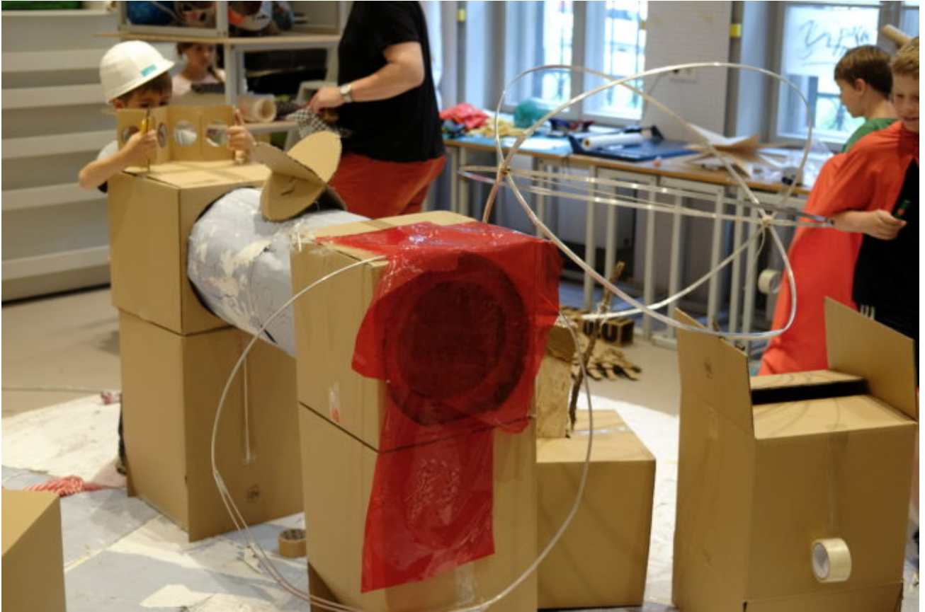
Abb. 6