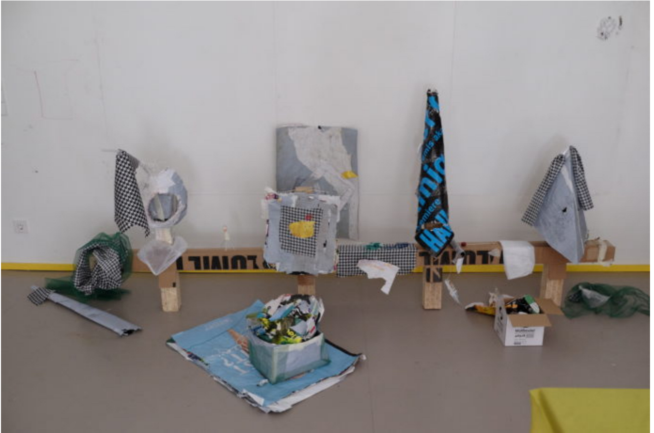
Abb. 3