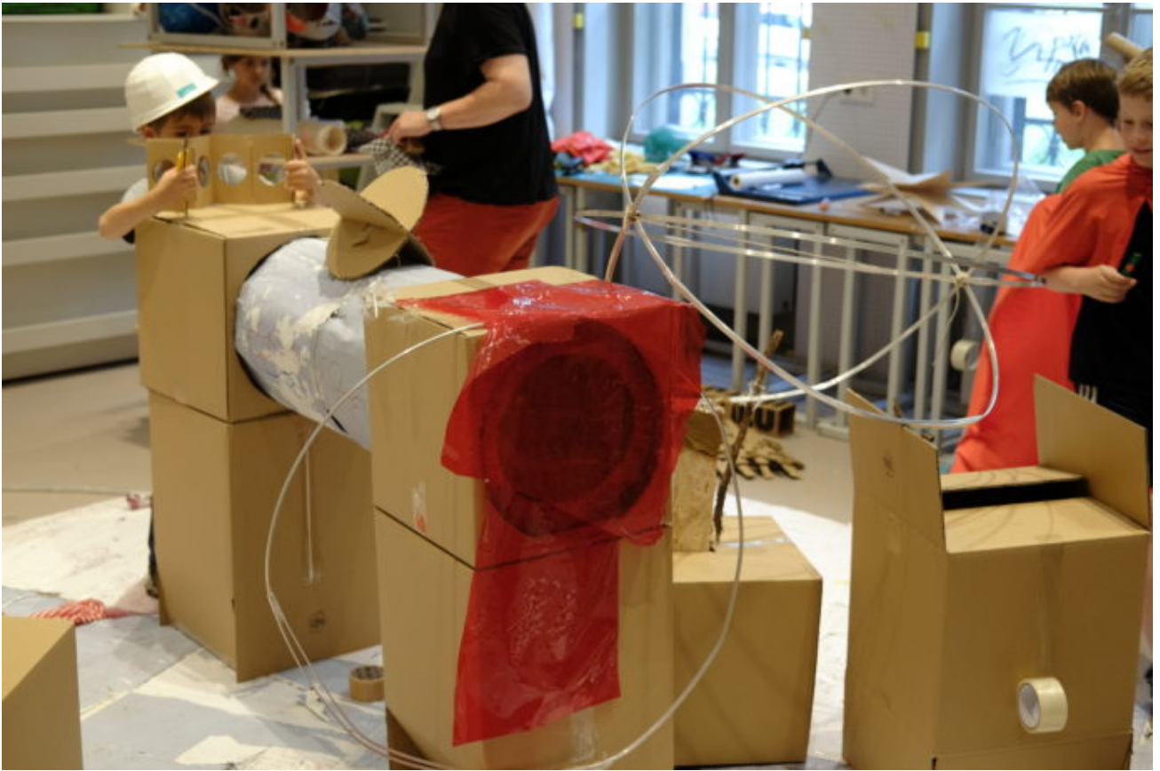
Abb. 6