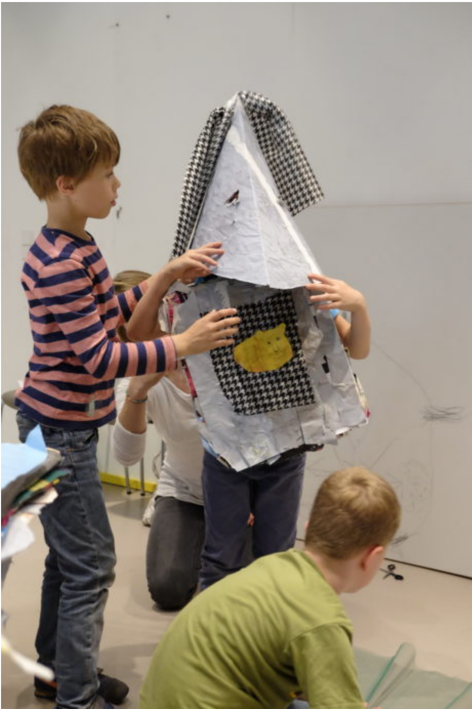
Abb. 5