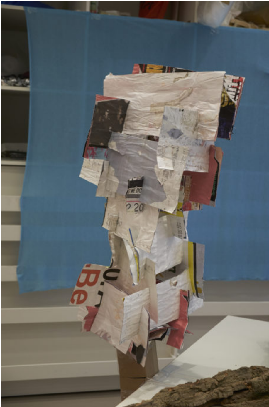
Abb. 1

Auch die Fähigkeit zu bewundern (...) (Pause, lacht), also nicht nur zu schauen, zu gucken, sondern zu bewundern, einmal nur zu staunen (...) also einfach nur, was man sieht, in sich reinfließen lassen (...) Und dann muss man das natürlich irgendwann bearbeiten, (...) Nick Ash in einem Interview mit Ursula Rogg (April 2017)