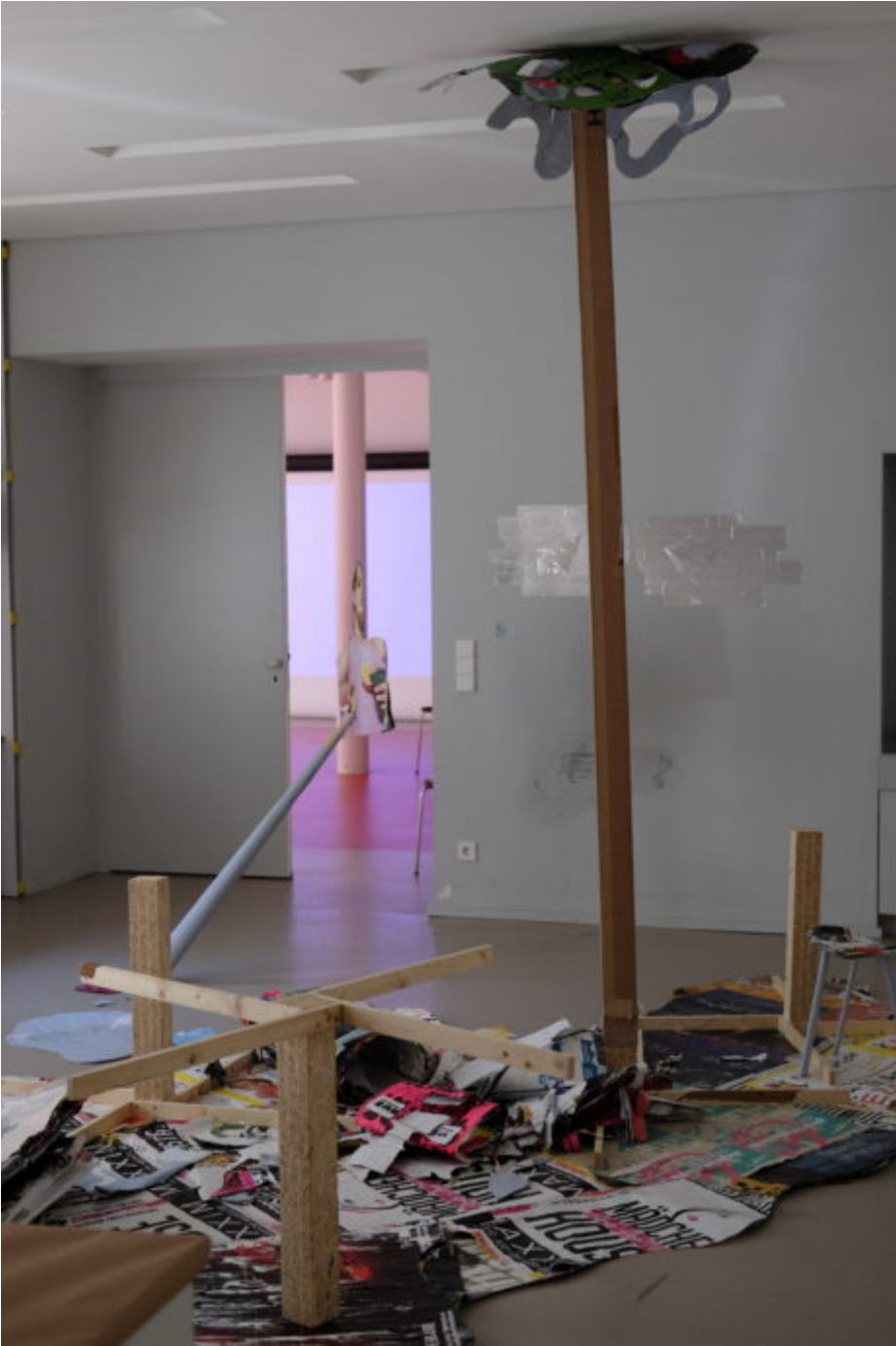
Abb. 2