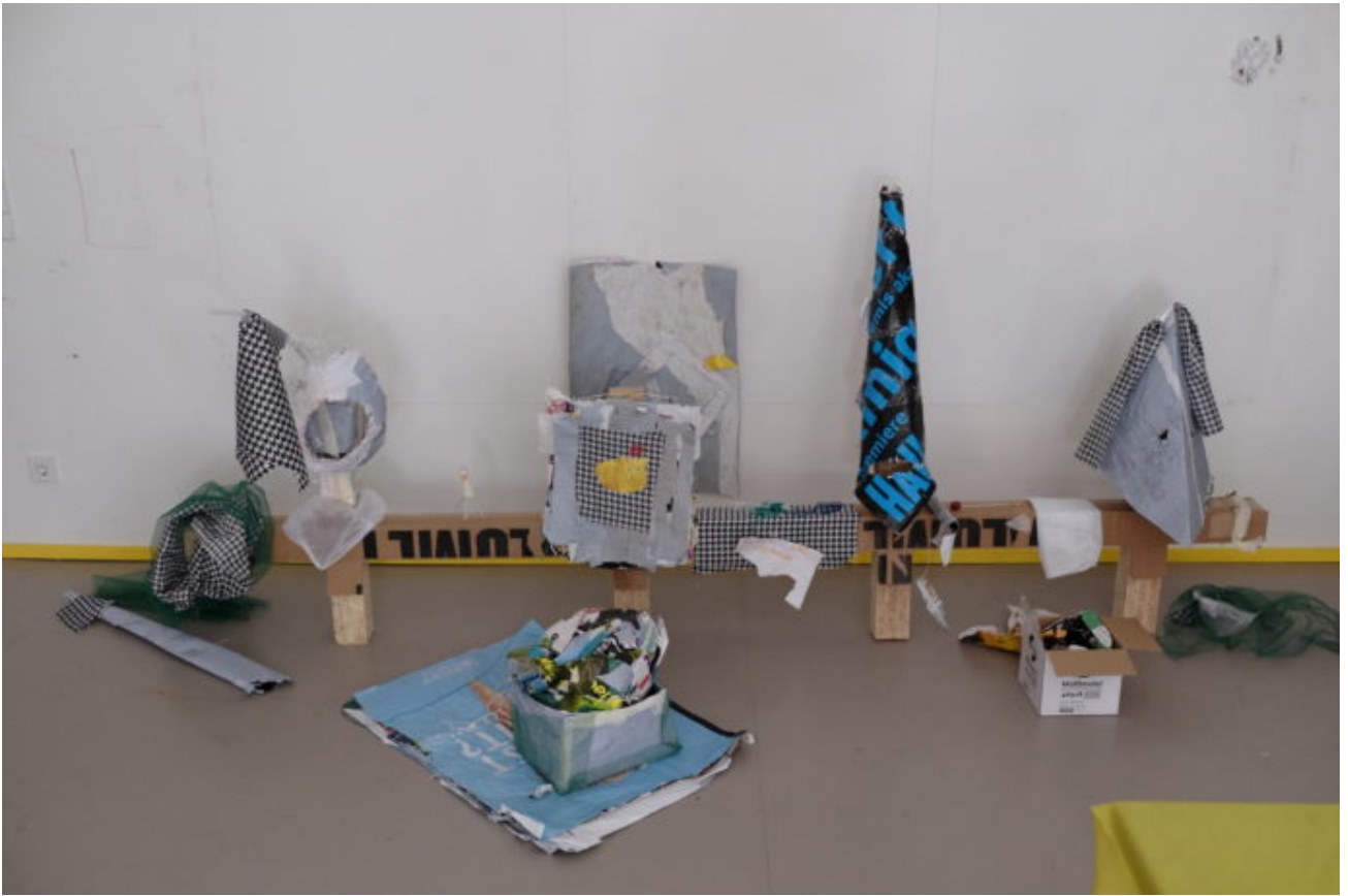
Abb. 3