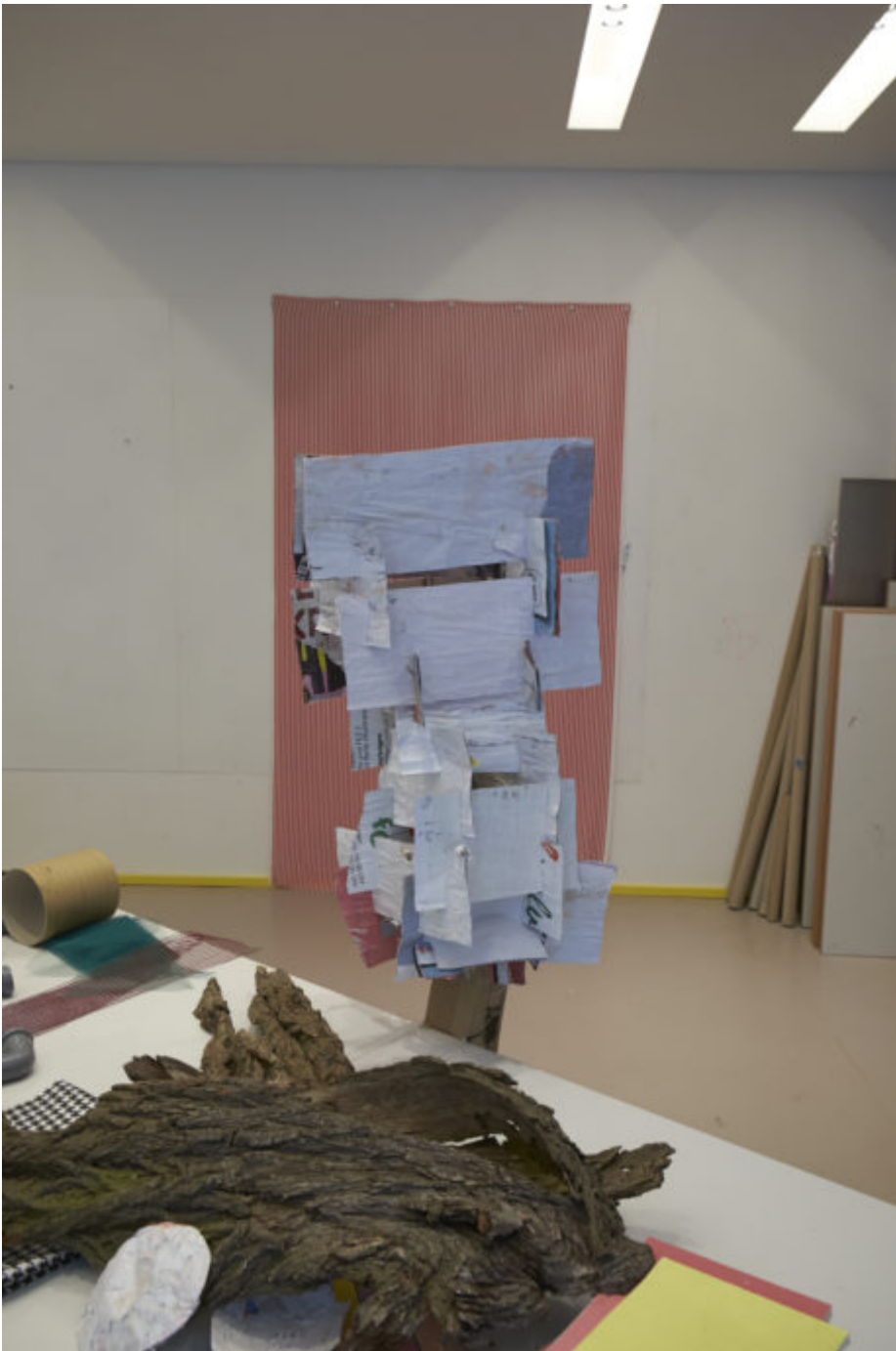
Abb. 4