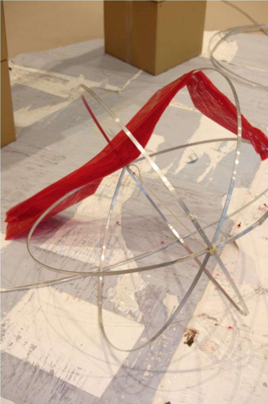
Abb. 8