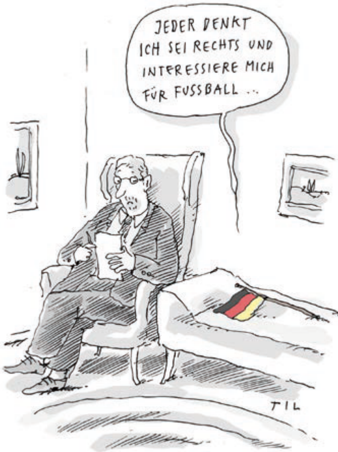
Abbildung: Til Mette (*1956): Fahne, Cartoon. ©Til Mette, 2018

Zum Einstieg soll das Beispiel der Karikatur von Til Mette angeführt werden (Fahne, 2018), die am Beispiel einer Fahne auf der Couch beim Psychiater, das Zusammenspiel historischer und gegenwärtiger Perspektiven bei der Betrachtung von einem Objekt verdeutlichen.