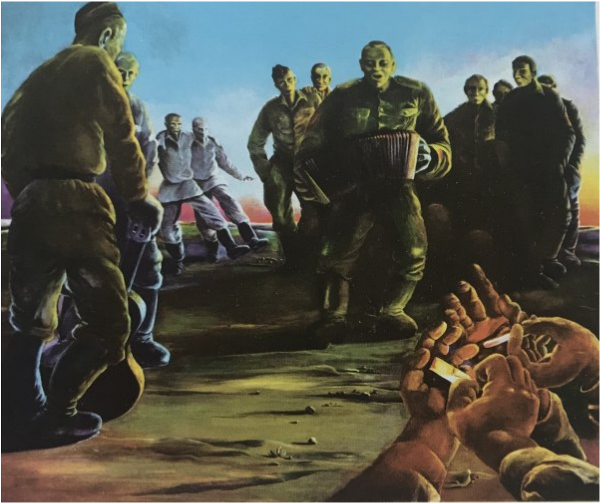
Abb. 6: Wolfram Knöpfler „Waffenbrüder nach dem Manöver“, 1980.