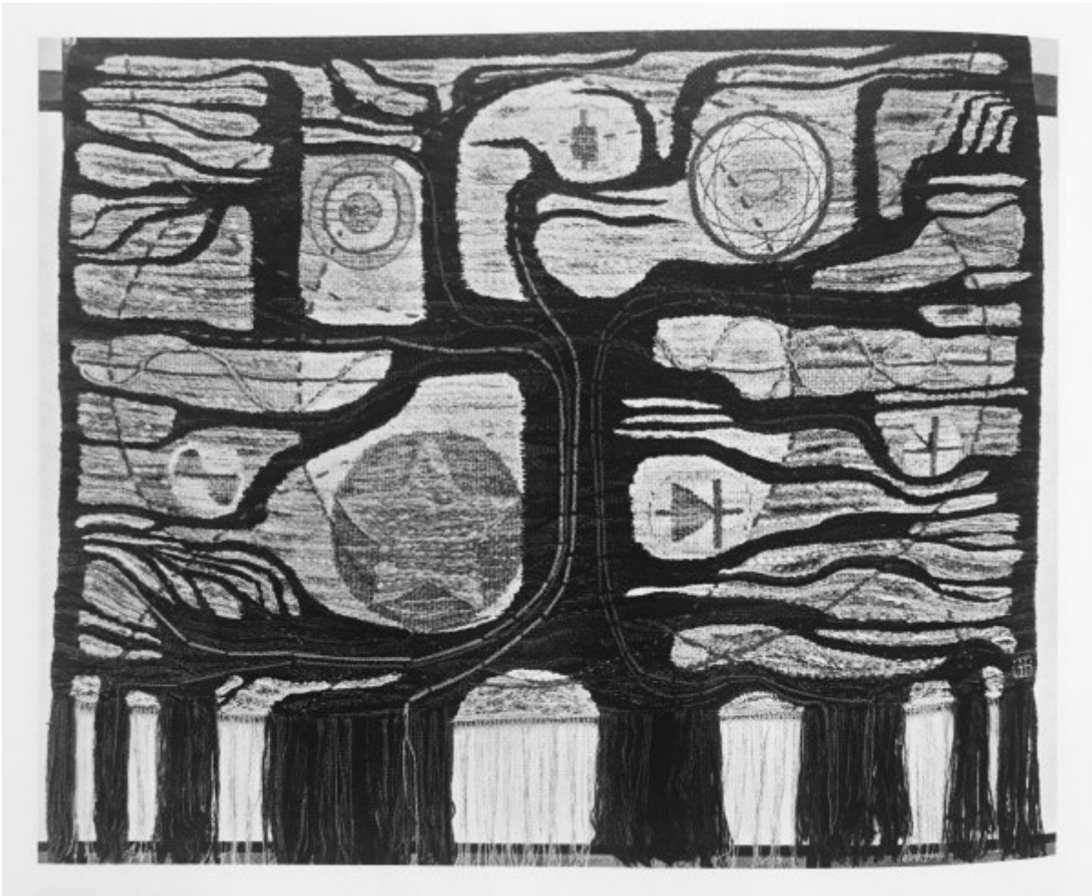
Abb. 8: Fördergruppe Bildwirker im Studio „Otto Nagel“ Berlin „Im Zeichen des Roten Sterns - Kabelbaum“, 1976/77.