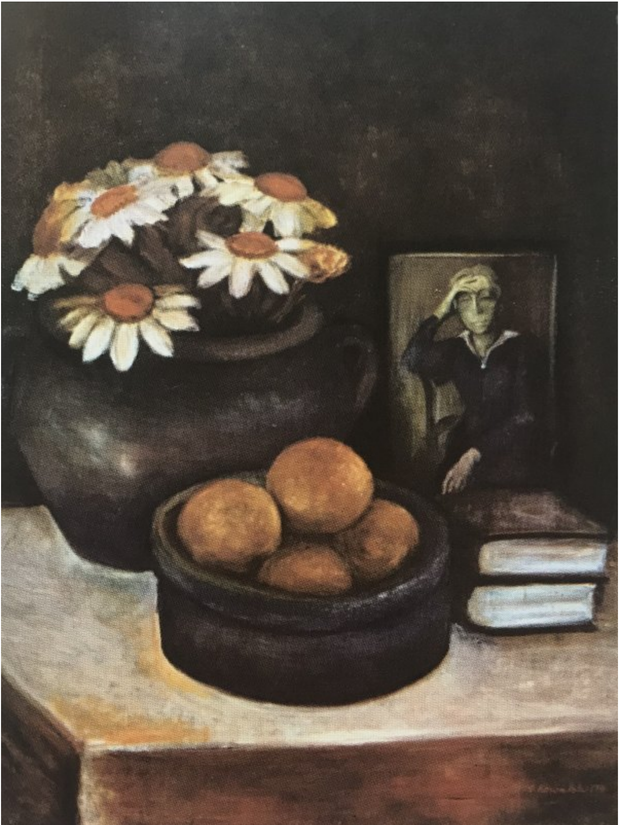
Abb. 7: Silke Kowalski „Stilleben“, 1979.