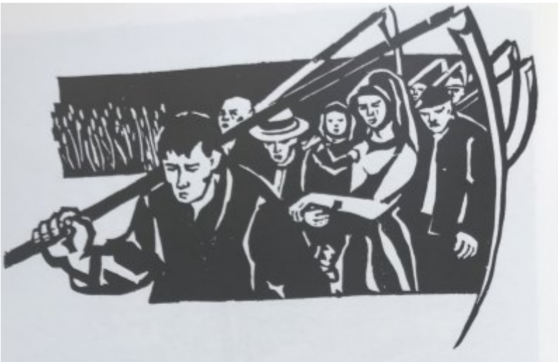
Abb. 4: Zirkel für Malerei und Grafik des VEB Wohnungsbaukombinat Neubrandenburg; Aus dem Zyklus „100 Jahre Mecklenburg“, 1966/67.

Die Mal- und Zeichenzirkel hatten neben ihrer Anbindung an Betriebe seit den 1950er Jahren Eingliederung in kommunale Einrichtungen, Klubs und Kulturhäuser gefunden. Die Durchführung zentraler Lehrgänge sowie die Einrichtung von Spezialschul- und Förderklassen, nicht zuletzt von Abendschulen an den künstlerischen Hochschulen ab 1960/63 ermöglichten nicht wenigen Amateuren eine Weiterbildung und stimulierten damit zugleich das künstlerische Niveau des bildnerischen Volksschaffens.