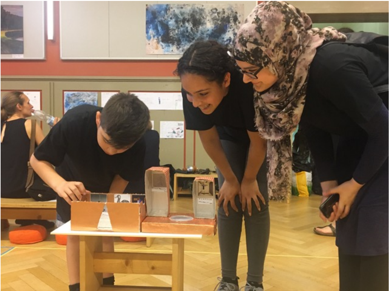
Hey Siri! Was ist ein Kurator?, Ausstellungseröffnung Aula, Juni 2019, Bild: sideviews.

Das Projekt war nicht nur für die Grundschüler*innen, sondern auch für die beteiligten Künstler*innen, Lehrpersonen und das Jugendgremium Schattenmuseum ein Forschungsprozess. Die entwickelten Experimente wurden von den Grundschüler*innen in einer Box – der SIRIBOX – zusammengefasst. Sie ist ein weiteres Ergebnis aus dem gemeinsamen Forschungsprozess und umfasst alle Experimente und interaktiven Handlungsanweisungen – zusammengestellt von den Grundschüler*innen. Die SIRIBOX ist in einer Auflage von 40 Exemplaren von Hand hergestellt worden. Jede Box ist ein Unikat. Die Experimente können einzeln aus ihr herausgenommen und ausprobiert werden. Sie ist erweiterbar, Experimente dürfen ergänzt werden.