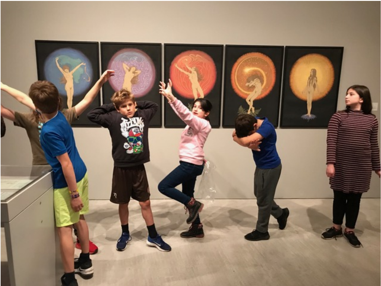
Hey Siri! Was ist ein Kurator?, Berlinische Galerie, Juni 2019, Bild: sideviews.

Entstanden sind Installationen, Texte, Modelle, Performances und Filmsequenzen, die Bezug auf die Sammlung der Berlinischen Galerie nehmen und sowohl dort als auch in der Schule inszeniert wurden. Den Abschluss des Projekts bildete eine interaktive Ausstellung in der Aula der Schule, in der die Prozesse und künstlerischen Bearbeitungen aus beiden Episoden zusammengeführt wurden. Acht Entwürfe von Museen aus Kinder- und Jugendperspektive begegneten einer Vielzahl von interaktiven Experimenten, Handlungsanweisungen und Vorschlägen, sich mit einem Werk, dem Museum und seinen Besucher*innen zu beschäftigen.