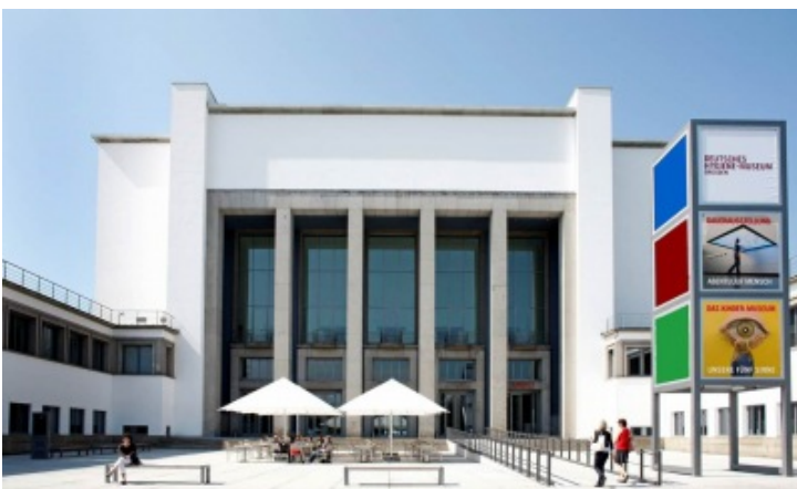
Deutsches Hygiene-Museum, barrierefreier Zugang

Für Menschen mit einer Behinderung gleicht der Besuch eines noch unbekanntes Museums unter Umständen einem Abenteuer. Es ist deshalb wichtig, dass sie sich im Vorfeld so genau wie möglich über Zugänglichkeit, Barrierefreiheit, inklusive Vermittlungsformate und ähnliches informieren können, um auf der Grundlage dieser Informationen ihren Besuch planen zu können. D.h. zum Beispiel: Stehen Behindertenparkplätze zur Verfügung? Ist der Museumseingang für RollstuhlfahrerInnen zugänglich? Gibt es ein Blindenleitsystem?