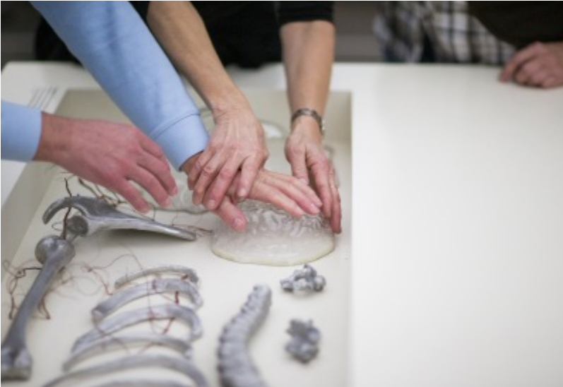
Taststation zu den Materialien aus denen die „Gläserne Frau“ besteht

Über diese Formen der Zugänglichkeit hinaus sollten jedoch auch die Ausstellungsthemen inklusiv gedacht werden – dies ist sicher eine der größten Herausforderungen. Das Deutsche Hygiene-Museum plant zum Beispiel die Neukonzeption des bestehenden Kinder-Museums zum Thema „Unsere Sinne“ als inklusives Kinder-Museum. Dabei wird es darum gehen, erfahrbar zu machen, dass die Sinne unterschiedlich ausgeprägt sind und unsere Wahrnehmung immer subjektiv ist.