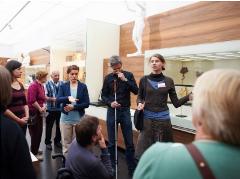
Öffentliche Führung mit Gebärdensprachübersetzung für BesucherInnen mit und ohne Behinderung im Rahmen des Apogepha-Publikumstages 2012, Foto: Oliver Killig

Inklusiv sind Veranstaltungen immer dann, wenn sie BesucherInnen mit und ohne Behinderung gemeinsam erleben können und dadurch auch dazu beitragen, ein selbstverständliches Miteinander zu etablieren.