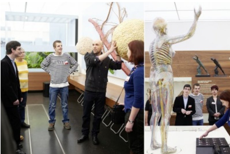
Öffentliche Führung in Leichter Sprache