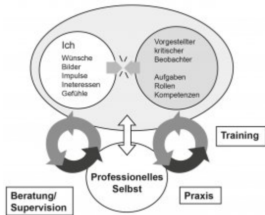
Abbildung 1: Entstehung des professionellen Selbst (aus: Bauer 2000:65)

Aus dieser Modellvorstellung kann ein holistisches Modell professioneller pädagogischer Handlungskompetenz entwickelt werden (vgl. Roth 2008): „Wenn die Erfordernisse der Situation mit dem individuellen Konglomerat von Fähigkeiten einer Person ‚zusammentreffen‘, so besitzt die Person ‚Kompetenz‘ zur Bewältigung der Aufgabe“ (Frey 2006:31). Die Instanz, in der dieses Zusammentreffen stattfindet – oder aktiver formuliert: die die Verbindung der Komponenten herstellt – ist das professionelle Selbst (vgl. Abb.2).