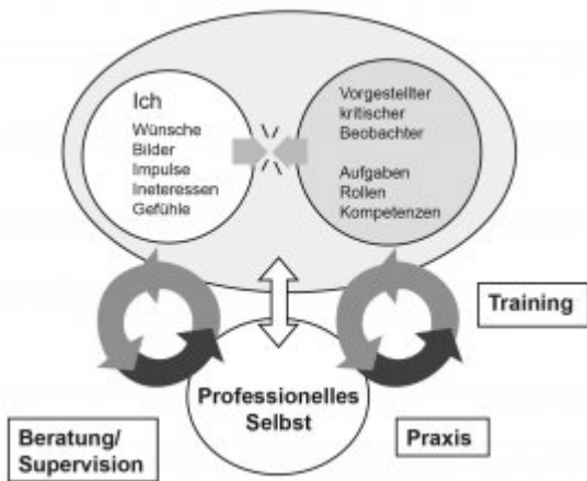
Abbildung 1: Entstehung des professionellen Selbst (aus: Bauer 2000:65)

Aus dieser Modellvorstellung kann ein holistisches Modell professioneller pädagogischer Handlungskompetenz entwickelt werden (vgl. Roth 2008): „Wenn die Erfordernisse der Situation mit dem individuellen Konglomerat von Fähigkeiten einer Person ‚zusammentreffen‘, so besitzt die Person ‚Kompetenz‘ zur Bewältigung der Aufgabe“ (Frey 2006:31). Die Instanz, in der dieses Zusammentreffen stattfindet – oder aktiver formuliert: die die Verbindung der Komponenten herstellt – ist das professionelle Selbst (vgl. Abb.2).